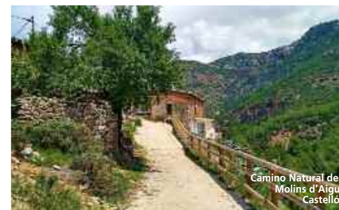
Camino Natural dels Molins d'Aigua Castellón

turquesa, dunas, sol, un sinfín de lugares que nos retendrán por su belleza y tranquilidad. Este es el exuberante viaje que ofrece el Camino Natural del Camí del Cavalls.