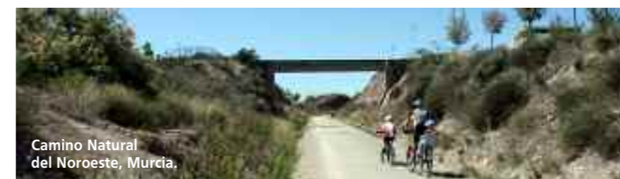
Camino Natural del Noroeste, Murcia.

Y si algo caracteriza esta isla es su naturaleza agreste batida por la constante tramon-