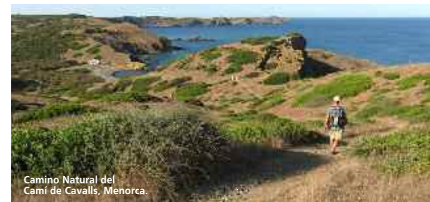
Camino Natural del Camí de Cavalls, Menorca.

Y encaramada en lo alto de una loma avistaremos Lucena del Cid –así apellidada por su heroísmo, (a pesar que el caballero medieval no estuvo allí)–. Tras atravesar la larga pasarela sobre el río, se accede a un pequeño cañón excavado en la roca y a una poza formada por un azud apta para el baño. Este refrescante recorrido termina en Penya Roja tras admirar los molinos de Panissares y de Penya Roja.